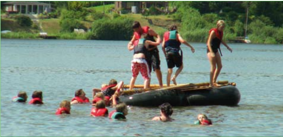
Floßbau – Erlebnispädagogik