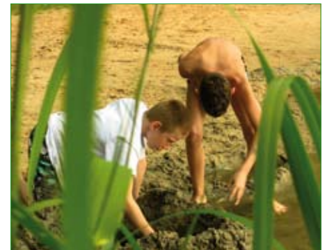
Programm Natur – Forschung – Erlebnis

Jede Gruppe wird während des Projektes von zwei ausgebildeten Trainern des Kooperationspartners betreut. Entsprechende Informationen geben zum einen die Internetseiten des Waldheimes und zum anderen sind diese bei der Heimleitung erhältlich.